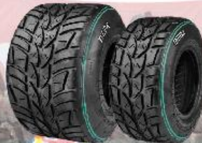
Wet Runner und Intermediate Runner